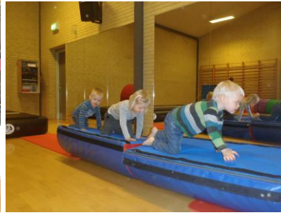
Bevægelse i hallen

Vi tænker meget bevægelse ind i børnenes hverdag, da vi er en DGI. På vores hjemmeside kan I finde flere oplysninger omkring dette koncept.