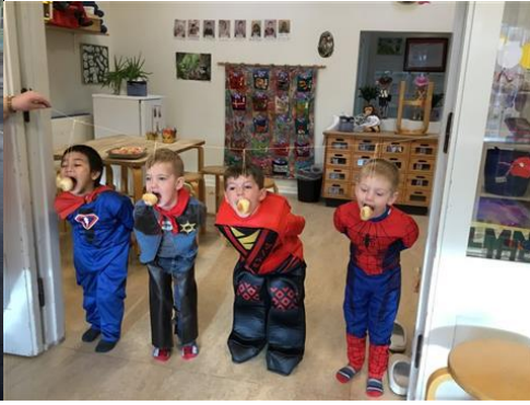
Vi bider til boller