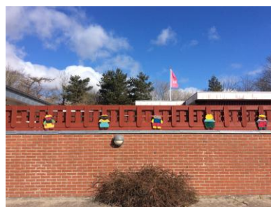
Børnehaven Troldehøjen venter på nye dejlige troldebørn