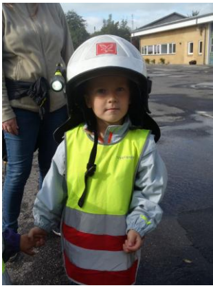
Brandmand for en dag.