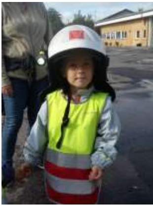
Brandmand for en dag.