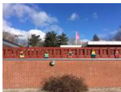
Børnehaven Troldehøjen venter på nye dejlige troldebørn