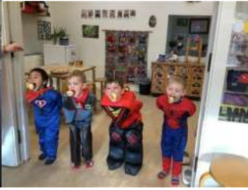
Vi bider til boller