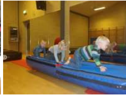
Bevægelse i hallen

Vi tænker meget bevægelse ind i børnenes hverdag, da vi er en DGI. På vores hjemmeside kan I finde flere oplysninger omkring dette koncept. Vi skal have pulsen op mindst 3 gange om dagen. Det sker bl.a. inden vores samlinger og ude på legepladsen ved voksenstyrede aktiviteter.